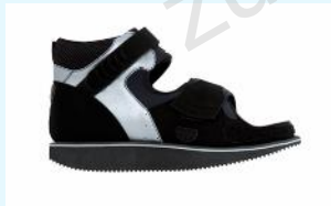
Verbandschuh 200 CHF pro Stück