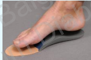
Einlage 410 CHF