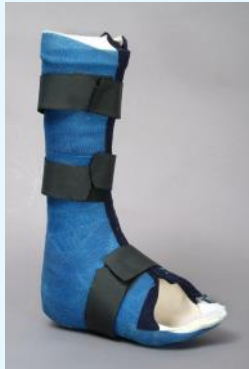
Gips 300 CHF pro Stück