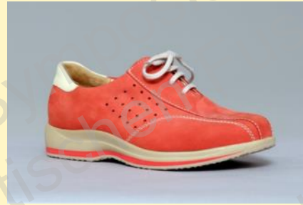
Serienschuh ca. 1200 CHF pro Paar