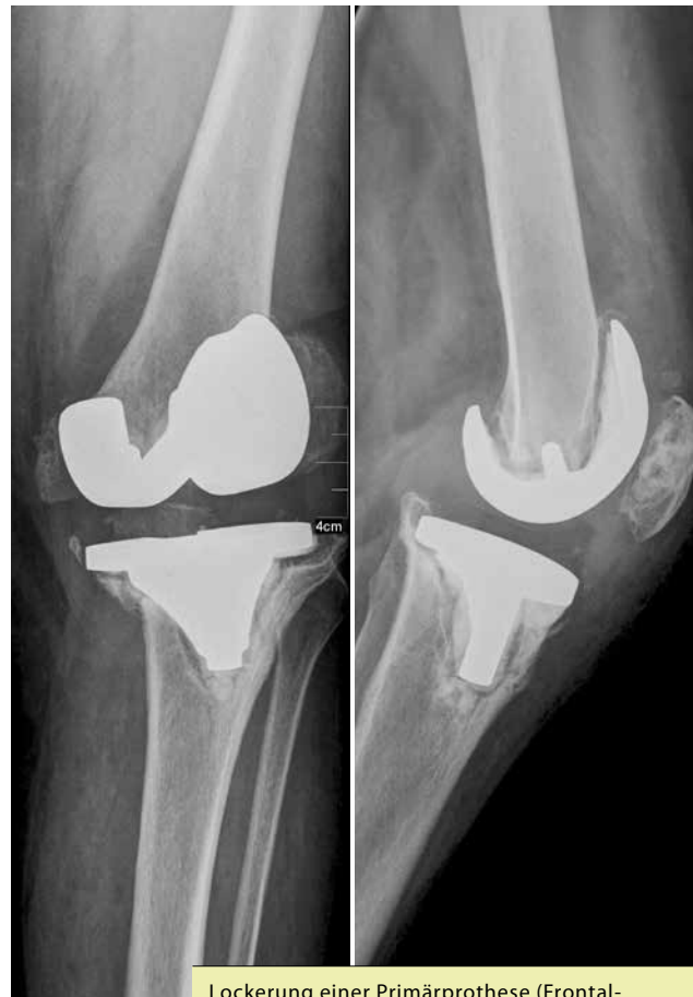
Lockerung einer Primärprothese (Frontal- und Seitenansicht)