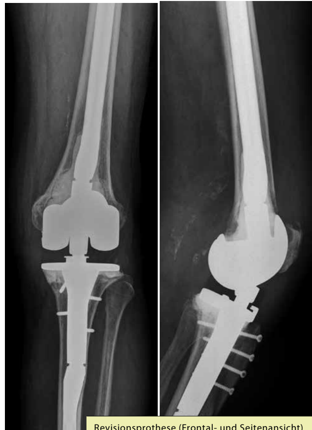
Revisionsprothese (Frontal- und Seitenansicht)

Falls aufgrund einer Lockerung oder einer Infektion der Wechsel einer Knieprothese notwendig ist, muss die so genannte Revisionsprothese der oftmals schwierigen Situation (Knochenverlust oder fehlende Bandstabilität) gerecht werden. Die Revisionsprothesen sind in sich enger geführt (weniger Abwinkelung), da die Funktion der Seitenbänder z.T. kompensiert werden muss. Da dabei mehr Reib- und Scherkräfte auftreten, müssen sie mit einem längeren Schaft in den Markräumen von Oberschenkelknochen und Schienbein verankert werden. Dies bedeutet eine ausgedehntere Operation mit mehr Blutverlust. Der Ersatz einer Teilprothese mit einer Totalprothese ist relativ einfach und kann meist mit einer Standardprothese erfolgen.