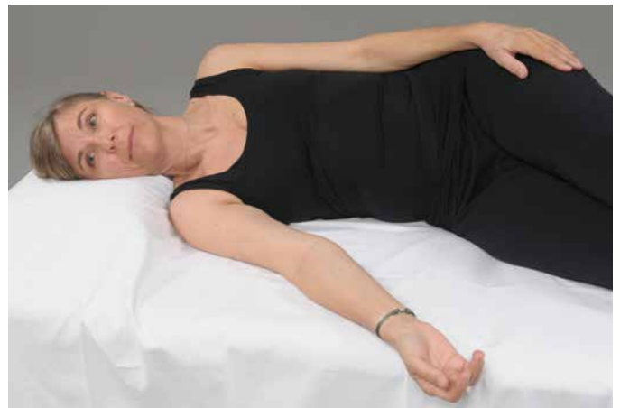
Abb. 1–4: Verschiedene Entlastungsstellungen für den rechten Arm.