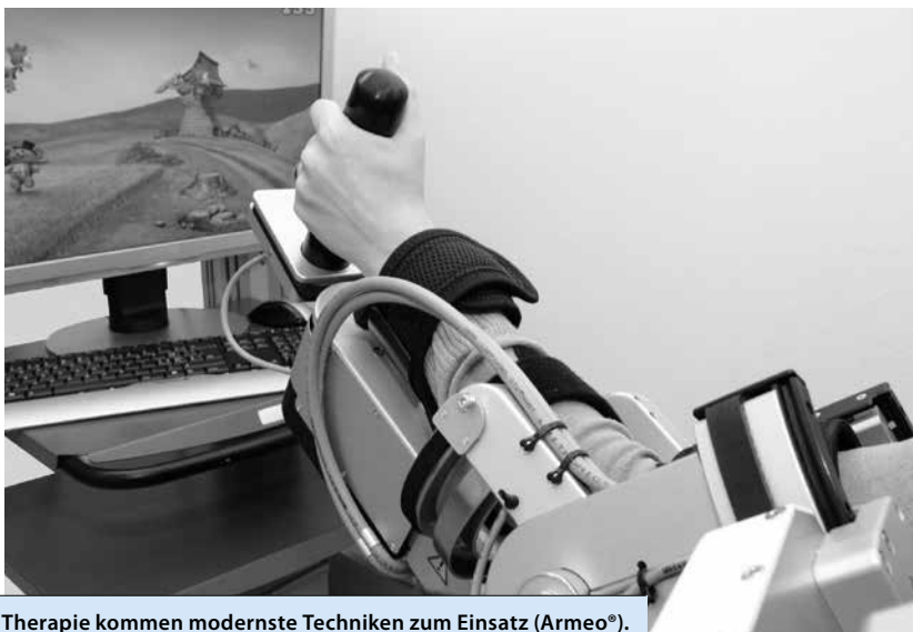
Bei der Therapie kommen modernste Techniken zum Einsatz (Armeo®).