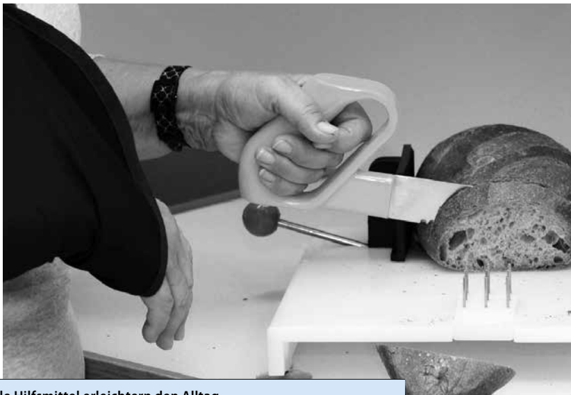
Spezielle Hilfsmittel erleichtern den Alltag.