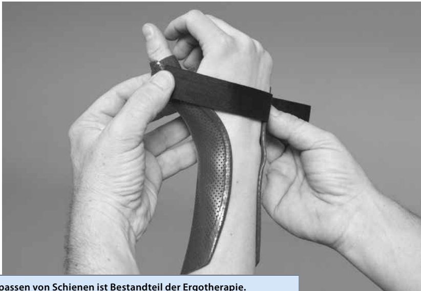
Das Anpassen von Schienen ist Bestandteil der Ergotherapie.